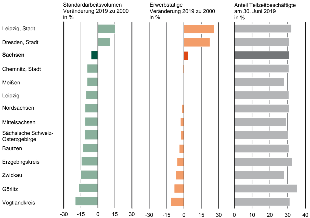
Abb. 1 Standardarbeitsvolumen, Erwerbstätige 1) und Sozialversicherungspflichtig Beschäftigte in Teilzeit im Freistaat Sachsen 2019 nach Kreisfreien Städten und Landkreisen